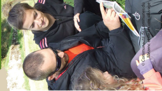
© Communauté de communes du Mézenc, en Haute-Loire, sauvages