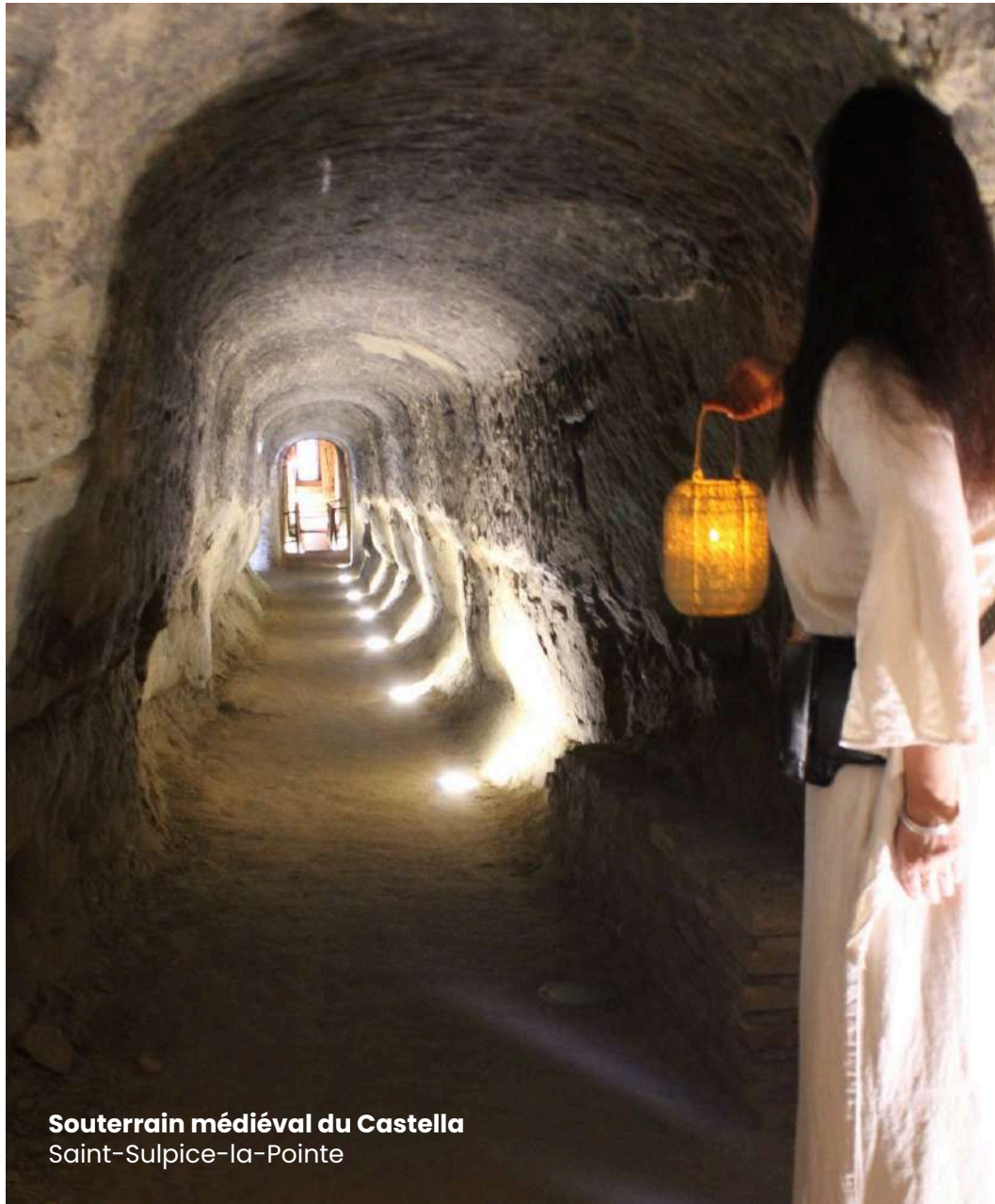
Souterrain médiéval du Castella Saint-Sulpice-la-Pointe