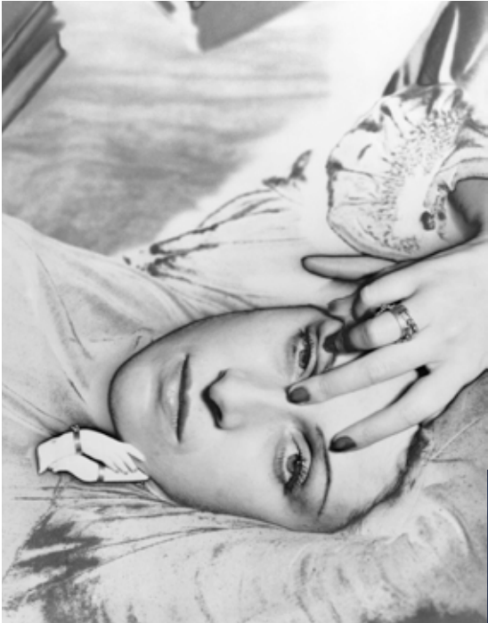
Dora Maar, 1936.

« C'est le visage humain qui m'intéresse. Dès que je vois un visage que je trouve intéressant, j'aime le photographier ». Entre 1922 et 1940, Man Ray photographie tous ses amis surréalistes, puis le tout-Paris passe devant son objectif.