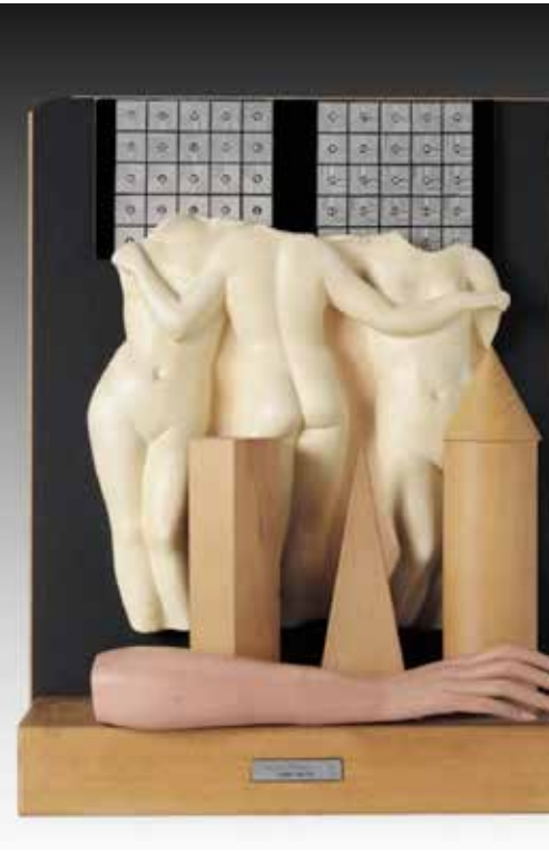
Target (Mire universelle). Œuvres en 3 dimensions © Man Ray 2015 Trust / ADAGP, Paris 2023.