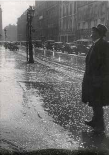
Paris, rue de la Paix, 1930 ca.

Poète-plasticien du 7 e art, Man Ray est reconnu comme cinéaste d'avant-garde avec ses quatre grands films: Retour à la raison (1922), Emak Bakia