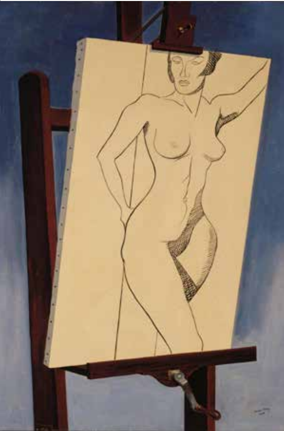
Easel painting (Peinture de chevalet). Huile sur toile © Paris, Centre Pompidou, MNAM-CCI, Dist. RMN-Grand Palais (Cl. Philippe Migeat) © Man Ray 2015 Trust / ADAGP, Paris 2023.

Les photographies de nus de Man Ray sont avant tout un hymne à la séduction du corps féminin, empreintes d'une séduisante pudeur. Elles ont un sens exceptionnel de la plastique, proche des sculptures antiques.