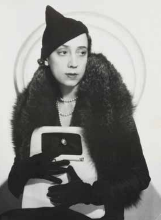
Elsa Schiaparelli, 1933 ca. (1926), L'Etoile de Mer (1928) et Les Mystères du Château du Dé (1929). Il se définit comme Directeur du mauvais movies .

La quasi-totalité des œuvres graphiques de Man Ray est reprise d'œuvres antérieures (huiles, gouaches, dessins, collages, photos, objets). Son processus de création artistique a toujours été guidé par cette facilité avec laquelle il faisait des répliques, des variations, de nouvelles éditions de ses œuvres.