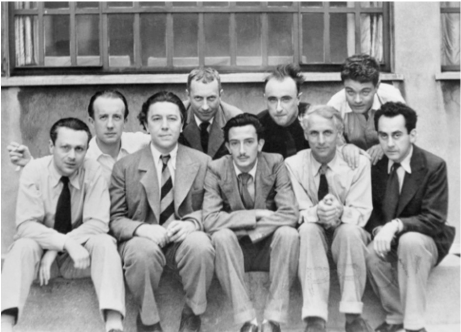
Groupe surréaliste, 1930 ca.