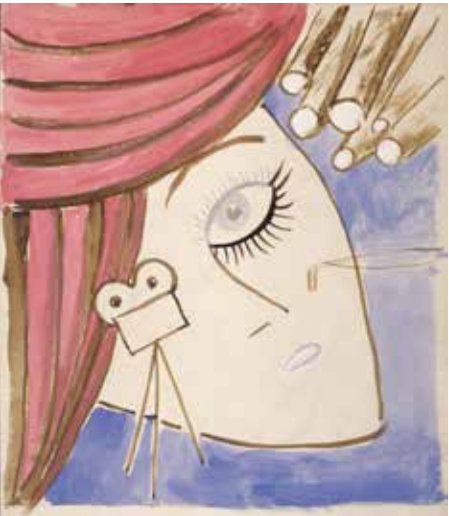
Sans titre, aquarelle et encre, S.D.