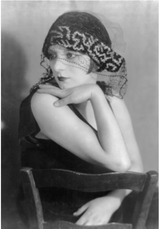
Kiki de Montparnasse, 1926.

L'autoportrait est un genre que Man Ray affectionne et qu'il a souvent repris tout au long de sa vie. Mais c'est surtout la photographie qui lui permet de se mettre en scène, de se déguiser, de se travestir.