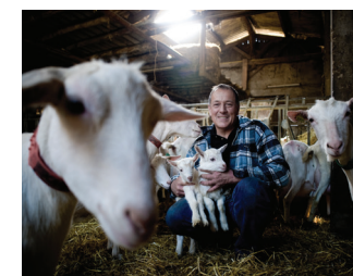
Ferme de Plantimay