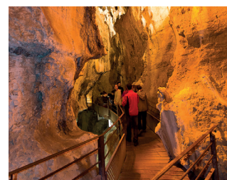
Grottes de St Christophe

Informations et autres idées de visites sur www.destinationchartreuse.fr/rsf ou sur la carte de la Route des Savoir-Faire et des Sites Culturels (disponible gratuitement dans les offices de tourisme du massif).