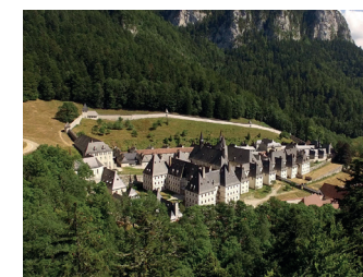
Musée de la Grande Chartreuse