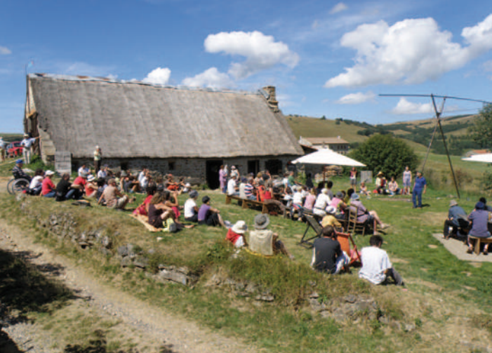
Jasserie du Coq Noir