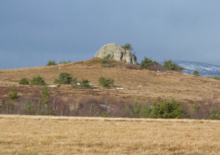
La Grande Pierre Bazanne sert de repère aux randonneurs et offre un large panorama sur un plateau aux allures de steppe