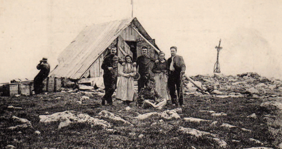
La première station de télégraphie optique, installée dans une simple cabane