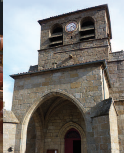
L'église gothique de Gumières et son porche précédant l'entrée