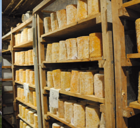
Une cave d'affinage de fourmes de Montbrison