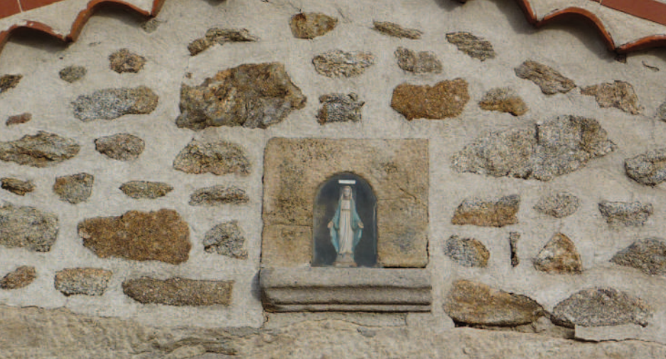
Niche abritant une statue de la Vierge sur le mur pignon de la jasserie des Planches