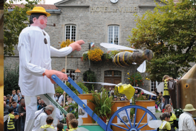
Fête de la fourme et des Côtes du Forez à Montbrison