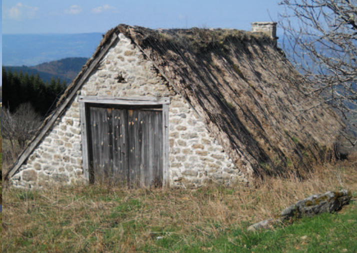
Les jasseries du col des Supeyres sont couvertes d'une toiture en chaumes. Le fenil, situé au-dessus de l'étable, est accessible de plain-pied