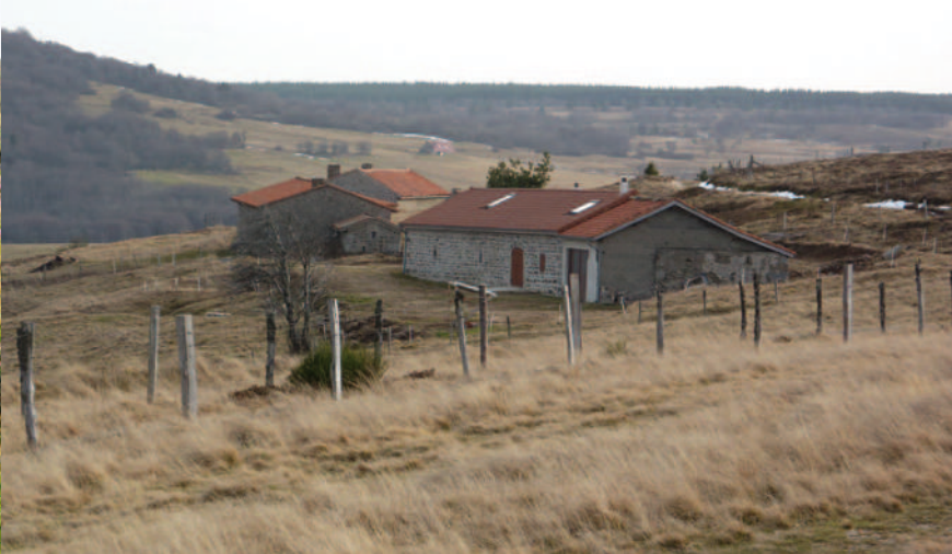
Les jasseries de Garnier dans un paysage automnal