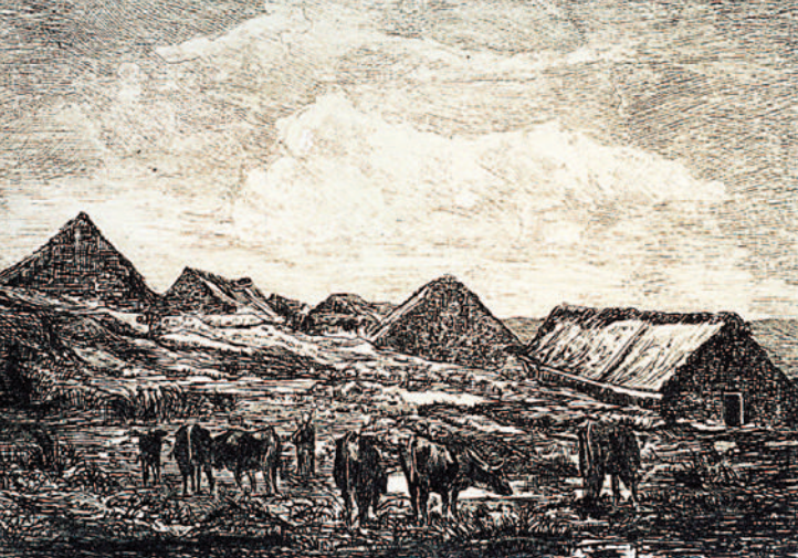
Les Jasseries de Colleigne. Dessin extrait de Félix Thiollier, Le Forez Pittoresque et Monumental, 1889