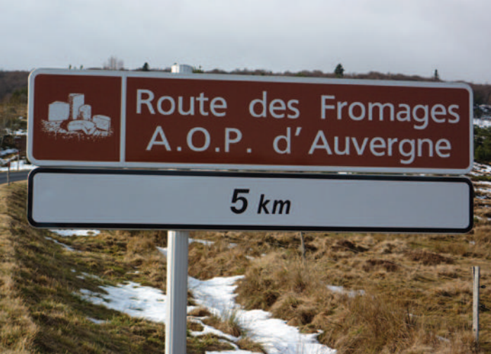
La Route des Fromages d'Auvergne vous guide chez les producteurs du Puy-de-Dôme