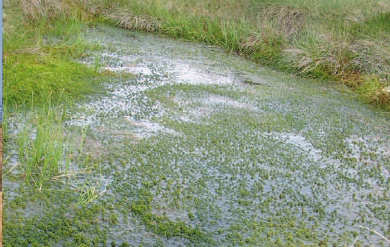
Une tourbière est une zone humide colonisée par la végétation dont le sol est saturé en permanence par une eau stagnante ou très peu mobile