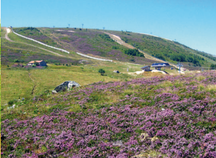
En été, les callunes en fleur parent les reliefs des Hautes Chaumes d'une couleur pourpre