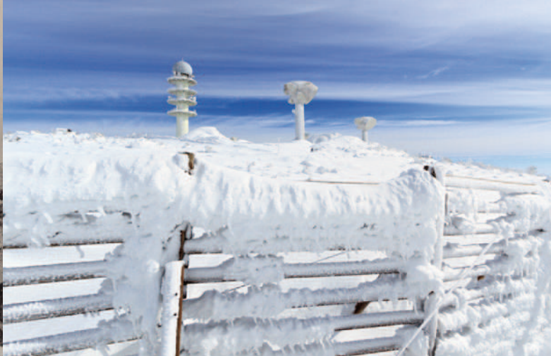
La station militaire prise dans le froid d'hiver