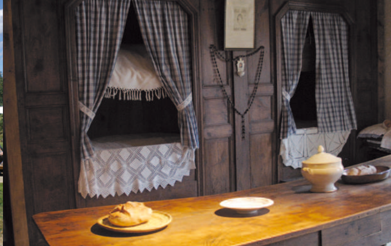
Musée de la Fourme et des Traditions populaires à Sauvain