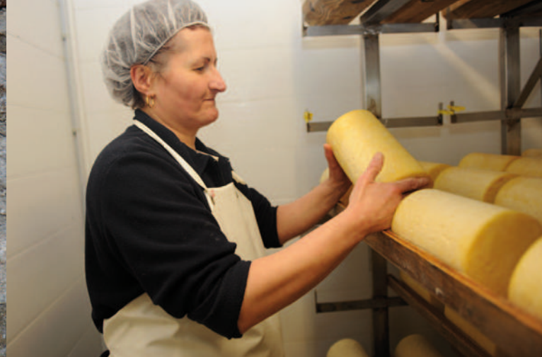
Fromagerie artisanale