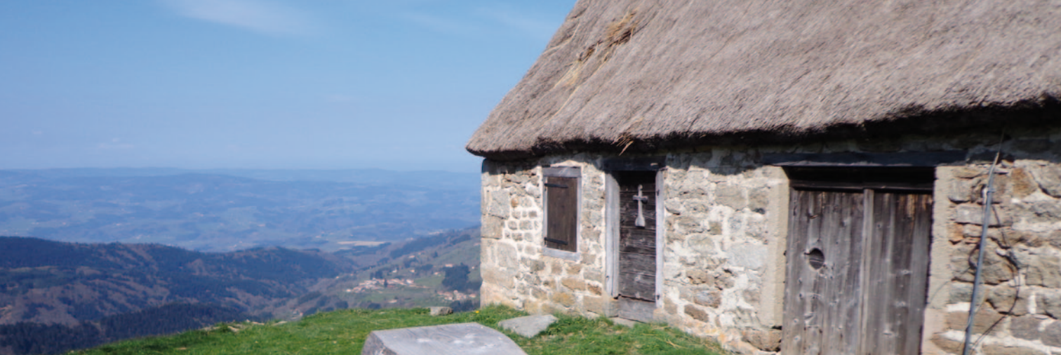
Depuis les jasseries des Supeyres s'ouvre un panorama sur les monts du Livradois et, en arrière-plan, sur la chaîne des Domes

Le Forez est labellisé « Pays d'art et d'histoire » depuis 1999, reconnu pour la qualité de ses paysages, de son patrimoine bâti historique et vernaculaire ainsi que pour ses savoir-faire artisanaux et industriels. « Villes et Pays d'art et d'histoire » est un label national du ministère de la Culture et de la Communication octroyé aux collectivités engagées dans des programmes de restauration et de valorisation du patrimoine. Il garantit la qualité des actions culturelles et patrimoniales par l'emploi d'un personnel qualifié. Aujourd'hui, un réseau de 184 villes et pays vous offre son savoir-faire sur toute la France.