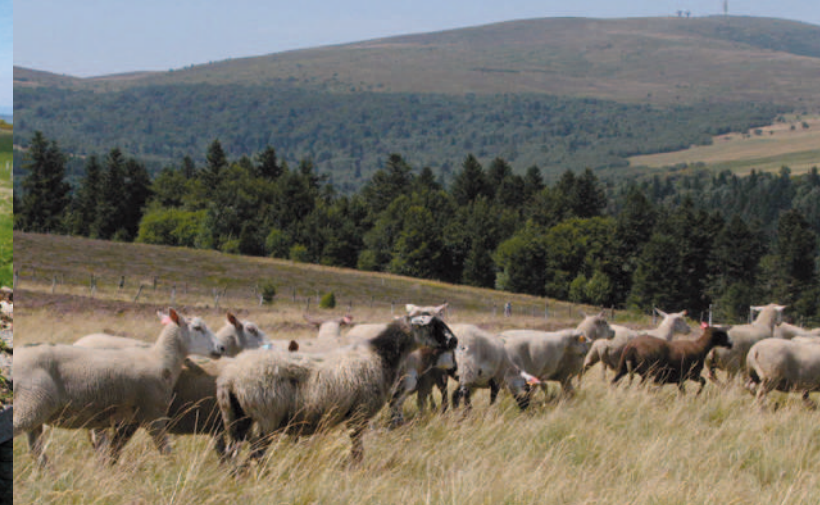
Interdit de pâture au Moyen Âge, le mouton est désormais très présent dans le paysage. Une fête lui est dédiée tous les mois de juillet à Garnier