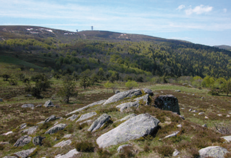
Les blocs granitiques, résultats de l'érosion glaciaire

Le sommet de Pierre-sur-Haute, situé à 1634 m d'altitude, est le point culminant des monts du Forez. Son nom provient d'une appellation en patois, signifiant la pierre du soir, sens modifié donc par la traduction française. Offrant une vue panoramique à 360° très dégagée sur plusieurs départements, les terrains sont achetés en 1907 par l'armée qui y installe une station télégraphique optique manuelle, fonctionnant principalement l'été. Ressemblant d'abord à une cabane sommaire de berger, la station sera construite en dur en 1920. En 1961, lors de la guerre froide, l'OTAN incite l'armée française à édifier, sur