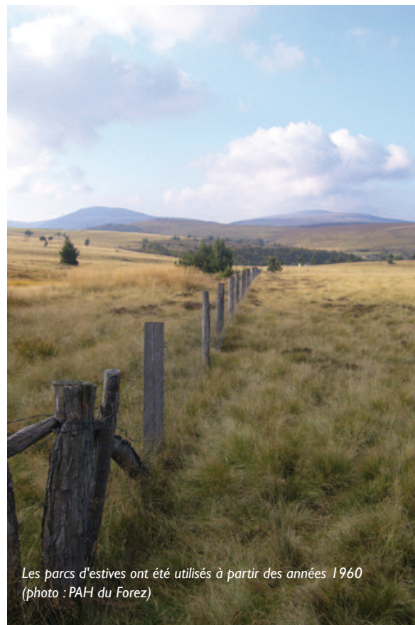
Les parcs d'estives ont été utilisés à partir des années 1960

droite avec une brutalité presque douloureuse, entraînant un gonflement réactionnel de la joue gauche qui s'accroissait lorsque le souffle d'Eole pénétrait par ma bouche entrouverte pour me gonfler comme un ballon ». Heureusement, de belles journées permettent de découvrir les Hautes Chaumes sous un jour plus favorable. Au début du 20e siècle, un organisateur montbrisonnais d'excursions estivales sur la montagne, en voiture hippomobile, ventait déjà les vertus des Hautes Chaumes en ces termes : « Monter à Pierre-sur-Haute, c'est aérer son esprit, rafraîchir ses bronches des senteurs parfumées du printemps, faire provision de santé et d'énergie ». Avis aux amateurs !