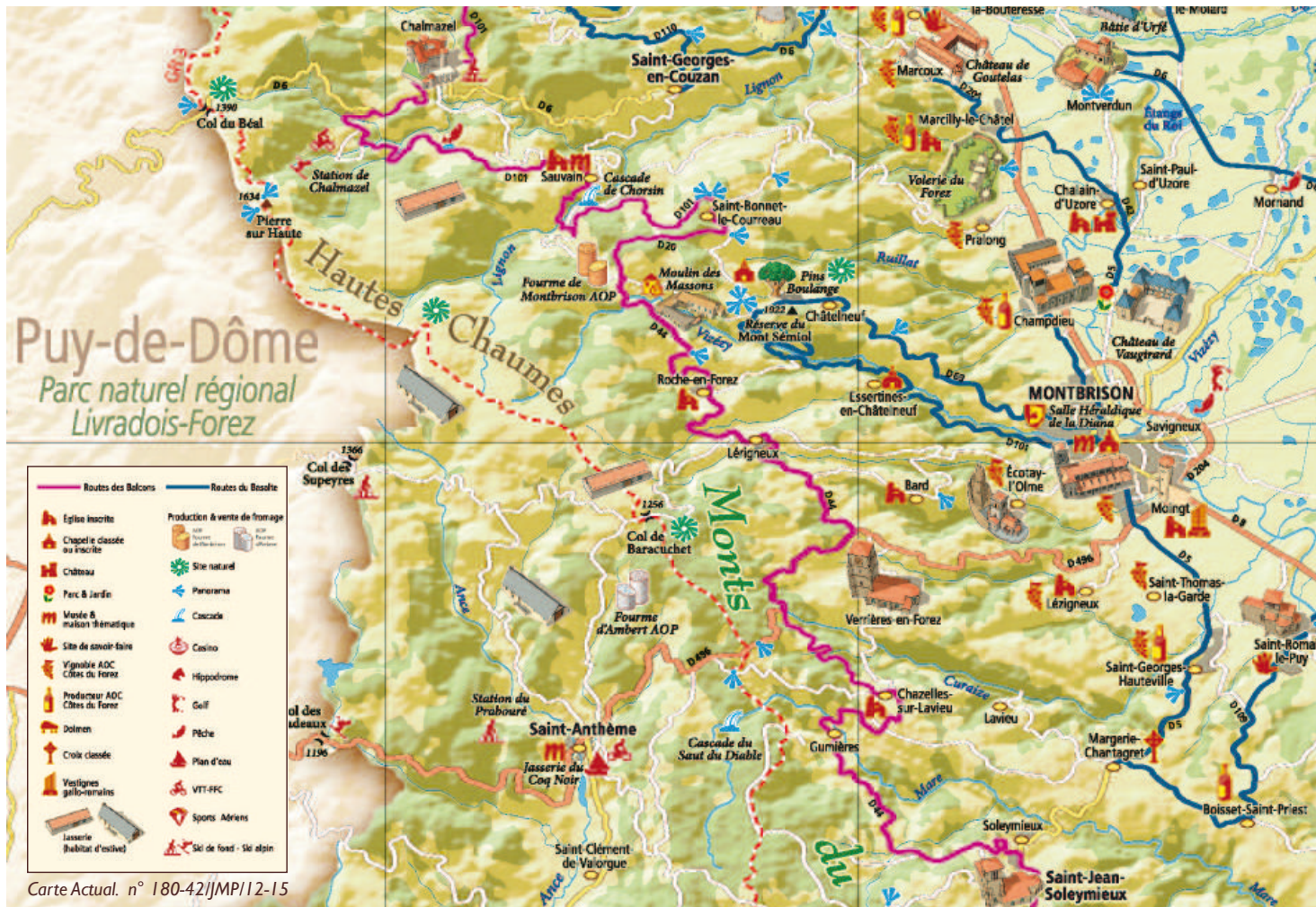
Carte Actual. n° 180-421JMP/12-15

Marat. En 1840, Saint-Pierre-la-Bourlhonne se constitue en paroisse autonome. Une église est construite sur les bases d'une ancienne chapelle de campagne, entre 1811 et 1840 et reçoit d'importants travaux de consolidation dans le dernier tiers du 19e siècle. Le Col du Béal est situé sur cette commune de tradition agricole. Les hauteurs sont ponctuées de nombreuses jasseries, pour la plupart de type franco-provençal. Au lieu-dit « Chez Leprêtre », on peut encore voir un tronçon de chemin pavé, autrefois emprunté par les troupeaux montant en estives sur les Hautes Chaumes.