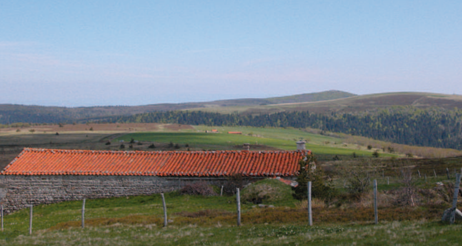
Les Hautes Chaumes depuis les jasseries de Colleigne