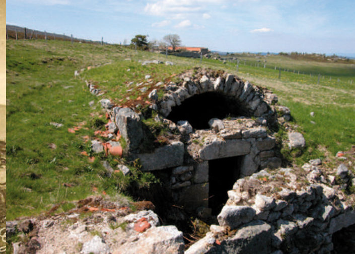
Ruines d'une cave à fourmes