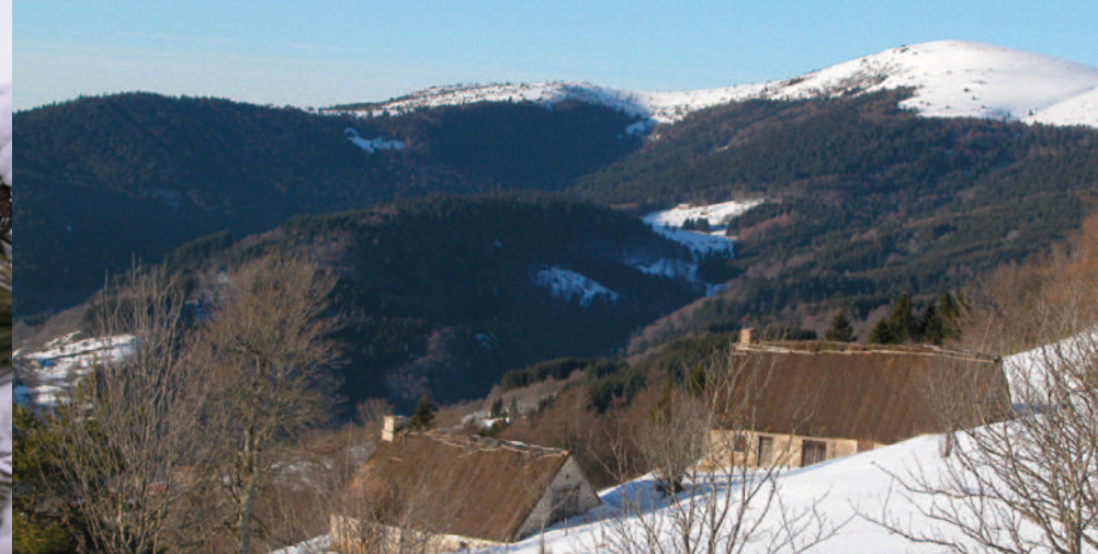
En hiver, les Hautes Chaumes sont emprisonnées sous un manteau de neige et de glace