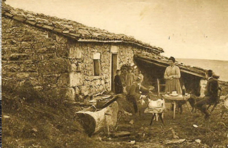
Carte postale ancienne : jasserie à Pierre-sur-Haute, fin du 19e siècle