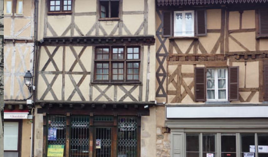
Le centre historique d'Ambert et ses maisons à pans de bois. La ville a donné son nom à la fourme auvergnate