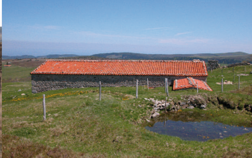
Une jasserie, à Colleigne : en premier plan, le réservoir d'eau appelé serve ou bonde, placé au-dessus de la cave à fourme accolée à la jasserie