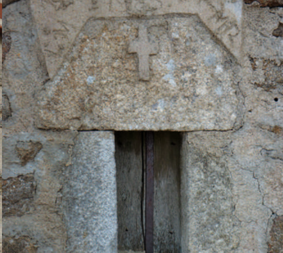
Une croix sur le mur pignon d'une cave à fourme à Garnier