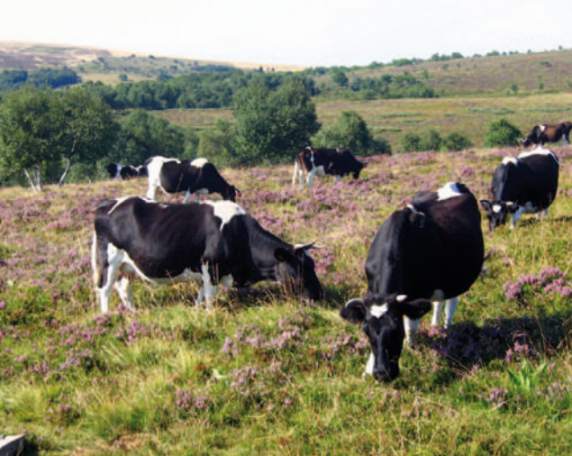
Troupeau de vaches laitières