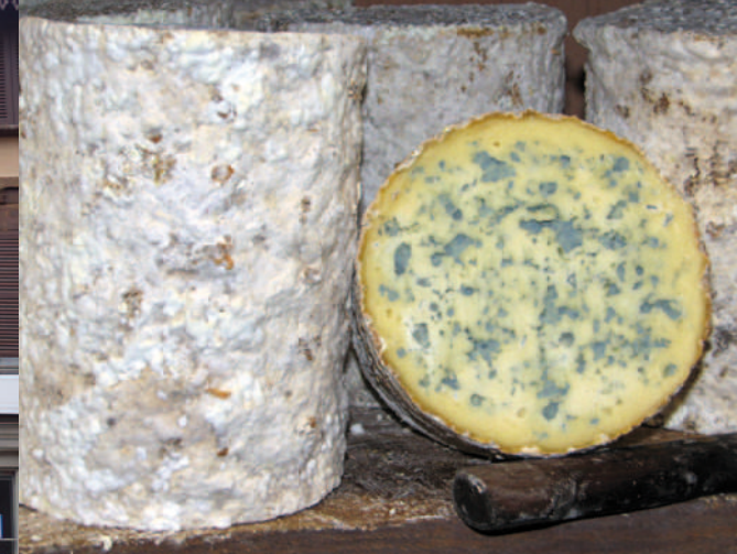
La fourme d'Ambert