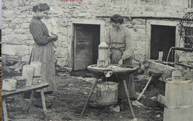
Cette carte postale ancienne illustre une scène ordinaire de la fabrication familiale de la fourme en jasserie.