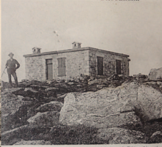
La station de télégraphie reconstruite en 1920