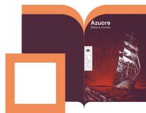
Azucré Bibiana Candia