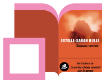
Basses terres Estelle-Sarah Bulle