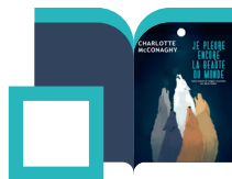
Je pleure encore la beauté du monde Charlotte McConaghy